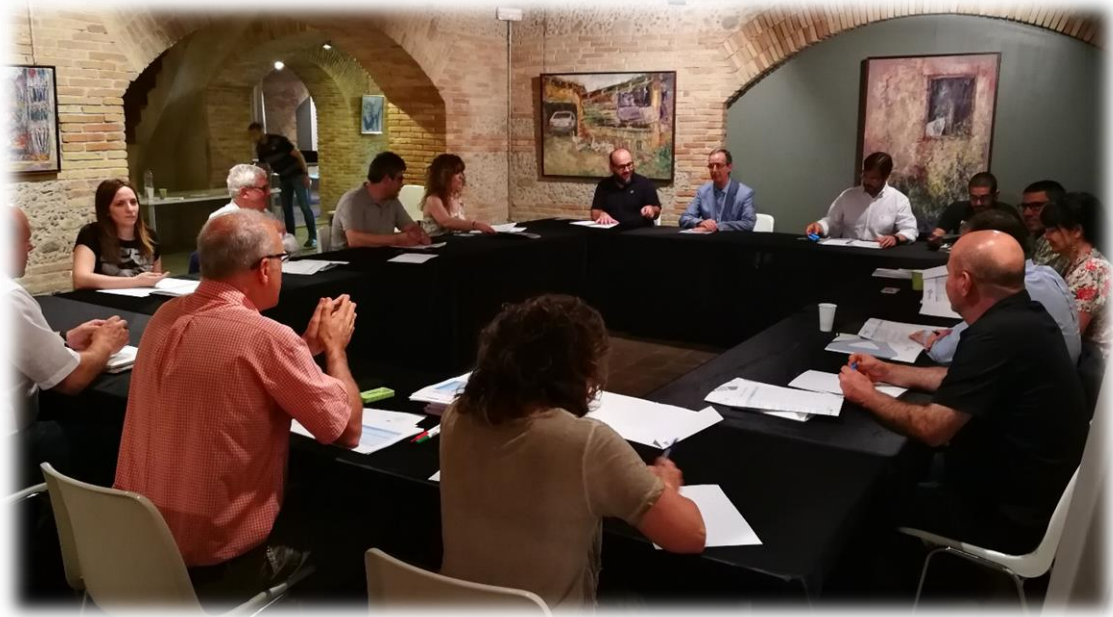
Desenvolupament de la Taula d'Indústria / ASPPE