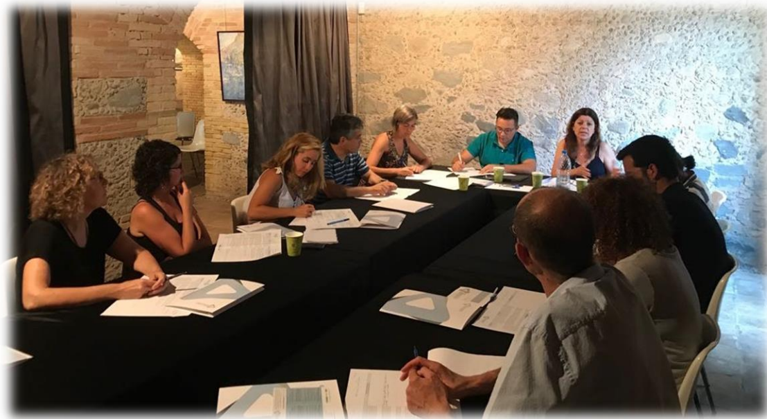
Participació a la Taula Social / ASPPE