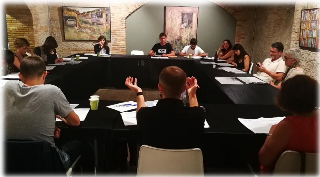
Participants a la Taula d'Economia Social i Solidària (ESS) / ASPPE