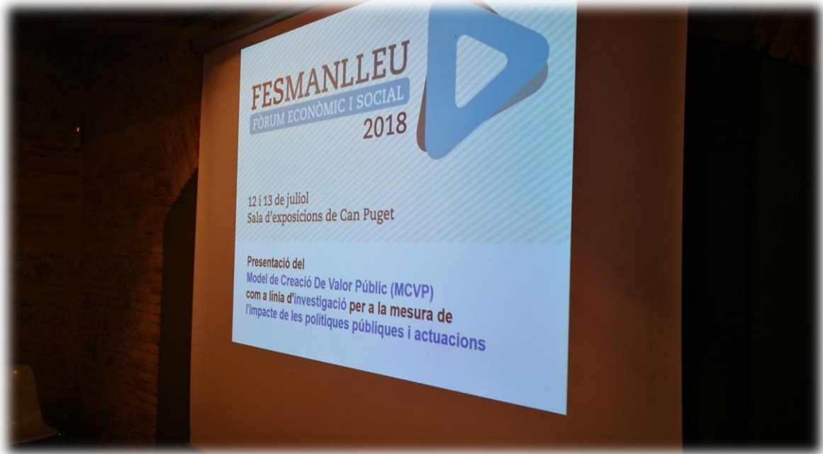
Foto: Edició del 2018 del Fòrum Econòmic i Social (FES Manlleu) / ASPPE