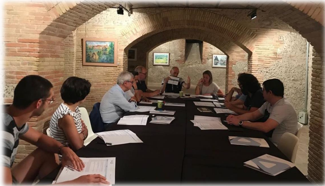
Transcurs de la Taula de Cultura, Esports i Turisme / ASPPE