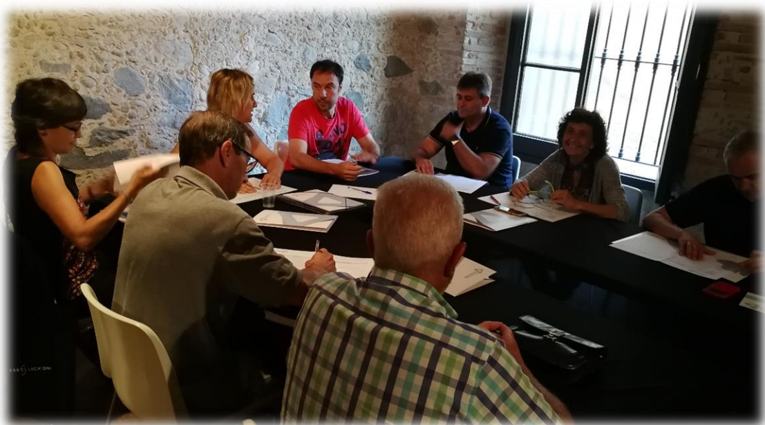
Espai per a la Taula d'Agricultura i Ramaderia / ASPPE