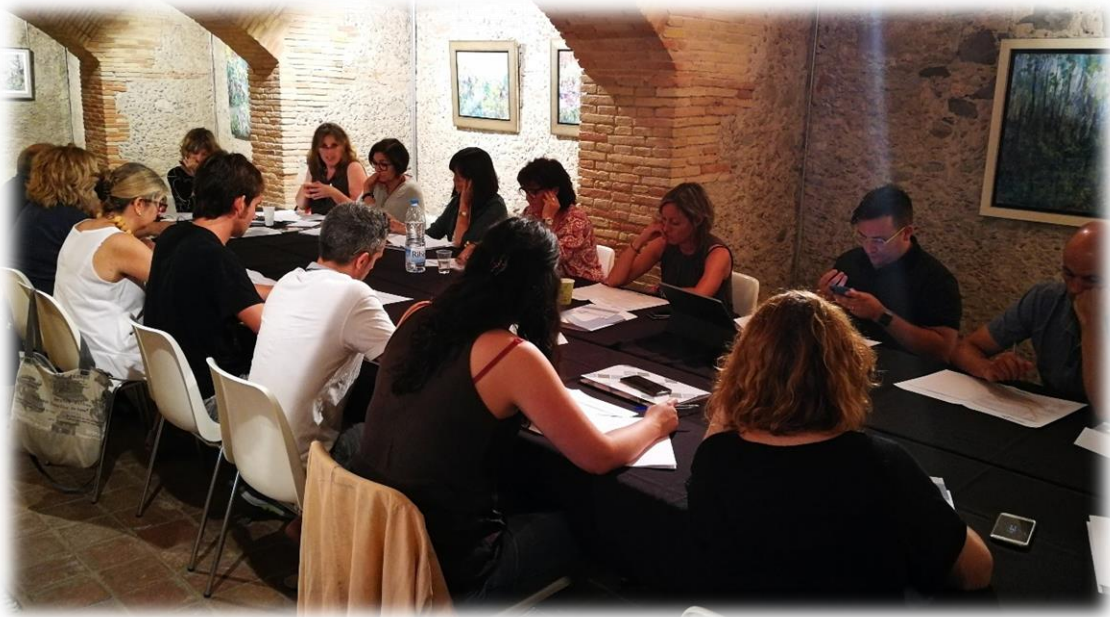
Taula de Comerç i Serveis / ASPPE