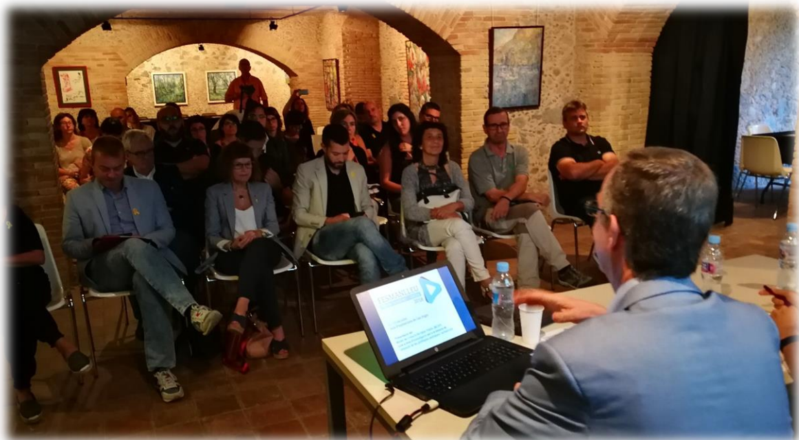
Públic assistent a la presentació de les jornades